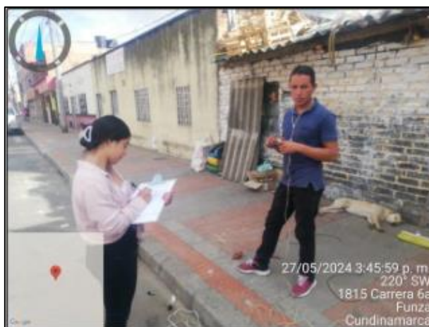
Ilustración 5. Visita ambiental recuperador de oficio