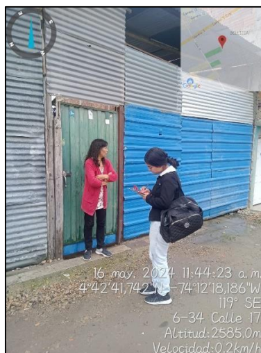
Ilustración 2. Acercamiento con comunidad

En dicha visita, la ciudadana manifestó que en el punto crítico (coordenadas 4°42'43.216" N – 74°12'18.838" W) se realiza inadecuada disposición de los residuos sólidos, ya que corresponde a un área utilizada para la disposición y separación de residuos por parte de los recicladores de oficio del barrio México, además que presenta un área de inseguridad y consumo para la comunidad.