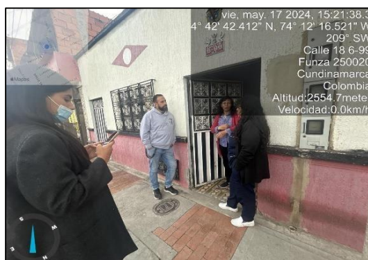
Ilustración 4. Visita equipo PGRIS

-Hacer llegar a la secretaria de Ambiente y Bienestar Animal evidencia fotográfica y videos que puedan ayudar a la identificación de los infractores (recicladores de oficio) para poder así, realizar un seguimiento de la inadecuada disposición de residuos y llevar un control de las actividades realizadas en dicho punto.