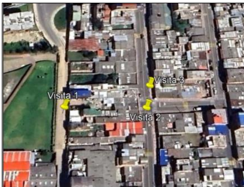
Ilustración 1. Visitas realizadas

Teniendo en cuenta que ante el municipio de Funza se interpuso queja por disposición inadecuada de residuos, el personal adscrito a la Secretaría de Ambiente y Bienestar Animal realizó visitas de control y vigilancia (ver ilustración 1) en el barrio México los días 16, 17 y 27 de mayo del presente año, con el fin de dar a conocer a la comunidad los comportamientos contrarios a la limpieza y recolección de residuos, así como las medidas correctivas a aplicar en caso de incurrir en alguno de dichos comportamientos, como se muestra en la siguiente ilustración: